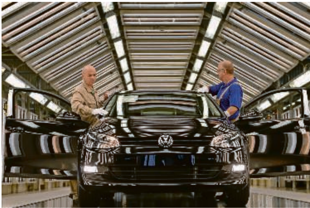
Trump truer den tyske bilindustri med en toldsats på 35 procent, men tysk industri er helt anderledes gearret end den liberale amerikanske.

Det er på grund af den liberale markedsøkonomis institutioner, at USA har førende virksomheder inden for bioteknologi, softwareudvikling og den finansielle sektor. Men den liberale markedsøkonomi er også med til at fremdrive overgangen fra industri- til videns- og servicesamfund, herunder udflytningen af industriarbejdspladser. Uden en velfungerende arbejdsmarkedspolitik, der kan omskole arbejdskraften, er det derfor oplagt, at den amerikanske arbejderklasse trækker det korteste strå i den globale kapitalisme. Det