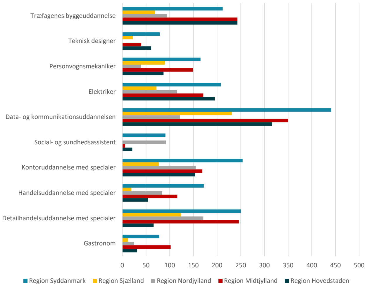
Figur 3: Antal søgende elever i de 10 uddannelser med flest praktikpladssøgende elever fordelt på regioner

Kilde: Uddannelsesstatistik, Børne- og Undervisningsministeriet, praktikpladsstatistik